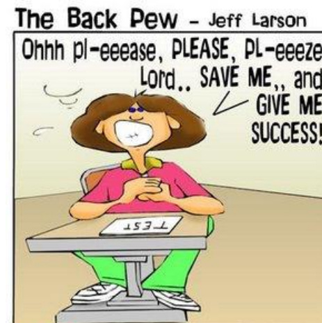
Ps 118:25 The Psalm of the unprepared student.